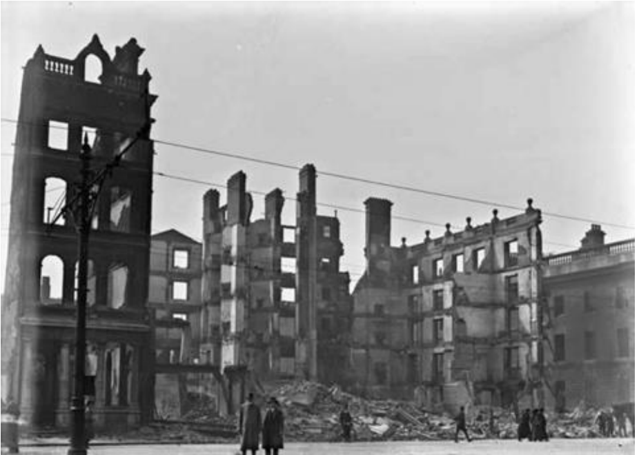
Britanya ordusunun saldırısının ardından Sackville Caddesi'ndeki Metropole Hotel enkazı

Başkaldırı altı gün sürdü ve Britanya Ordusu birlikleri tarafından vahşice bastırıldı. Ayaklanmanın ikinci gününde sıkıyönetim ilan edildi. Britanya ordusunun ezici bir üstünlükle ayırım gözetmeyen topçu ve ağır makineli tüfek ateşine güvendiği çatışmalarda, toplamda, 418 sivil ve isyancı ölmüş, Britanya ordusu 116 kayıp vermişti. 2.600 dolayında insan yaralandı ve kentin büyük kısmı harabeye döndü.