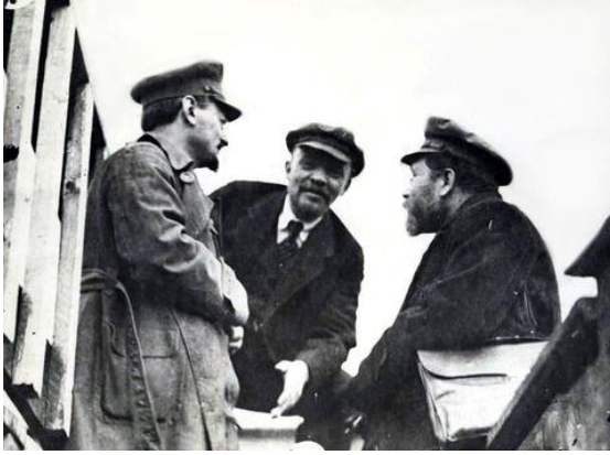
Lev Kamenev ile Troçki (solda) ve Lenin (ortada)

Connolly, 1914'ün ardından asıl enerjisini burjuva milliyetçi güçler ile bir ittifak içinde silahlı ayaklanma hazırlamaya odaklarken, 1917 Rus Devrimi'nin en önemli iki önderi, oportünizmin tüm biçimlerine karşı amansız bir siyasi mücadele ihtiyacını vurgulamış, devrimci taktiklerin ve stratejinin gelişmesinde enternasyonalist bir yönelim gerekliliği konusunda ısrar etmişlerdi. Lenin'in 1903'ten itibaren Menşeviklere karşı kararlı mücadelesinin ve Troçki'nin sürekli