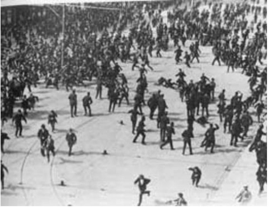
Polis, Ağustos 1913'te, Dublin Lokavtı sırasında Sackville Caddesi'ndeki bir mitingi dağıtıyor