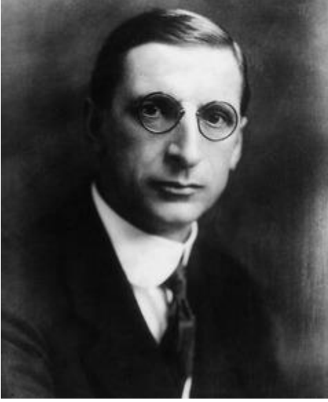
Eamon de Valera

Britanya emperyalizmi ile Anglo-İrlanda Antlaşması'nı kabul ederek devrimci mücadelelere erkenden son verdiler.