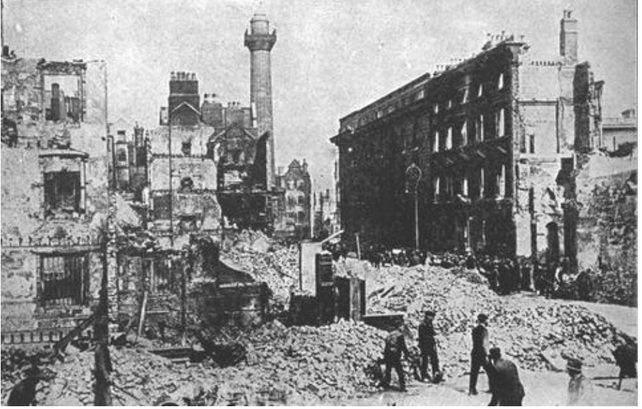
Britanya silahlı kuvvetlerinin saldırısının ardından Dublin, Sacville Caddesi (bugünkü O'Connell Caddesi)

Haftanın büyük kısmında Britanya ordusuna komuta eden Tuğgeneral William Lowe, kente giren Britanya askerlerinin herkese potansiyel bir düşman olarak muamele etmesi gerektiği yönünde bir emir yayınladığında, Dublin halkına yönelik acımasız bir aldırılmazlık sergiledi. O, “Kollar, ateş açılan evlerin sakinleri imha edilene veya ele geçirilene kadar, hiçbir şekilde onların ötesine ilerlemeyecektir.” emri vermiş ve eklemişti: “Bu tür bir evdeki her insan, silahlı olsun ya da olmasın, isyancı olarak kabul edilebilir.”