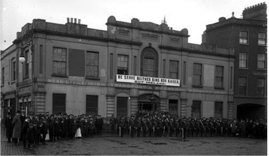
Özgürlük Salonu dışındaki İrlanda Yurttaş Ordusu bölüğü

Üyeleri kent işçilerinden ve yoksul kır nüfusundan gelen İrlandalı Gönüllüler’in en iyi unsurlarının desteğini kazanmaya çalışmakta ilkesel olarak yanlış bir şey yoktu. Onların birçoğu, Britanya emperyalizmine ve onun savunduğu sosyal düzene yönelik güçlü bir nefretle doluydu. Fakat Connolly’nin yönelimi, her şeyden önce, bağımsız, kapitalist bir İrlanda’nın kurulması perspektifine yönelik önceki eleştirisinin önemini azaltan siyasi nitelikte tavizler içeriyordu.