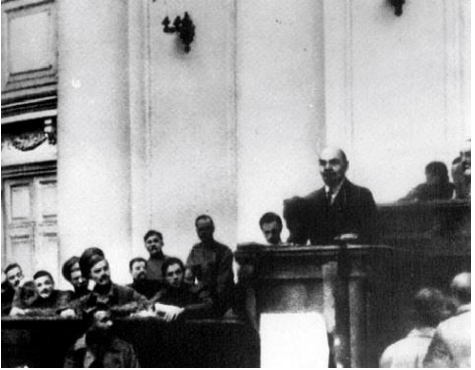
Lenin Nisan 1917'de Petrograd'da konuşurken

Troçki, Dublin'in sokaklarında barikatlar kurup Britanya ordusuna karşı savaşmış olanları "kahraman" olarak betimliyor ve işçi sınıfının, harekete, "militarizme yönelik sınıfsal nefretini katmış" olduğunu ekliyordu.